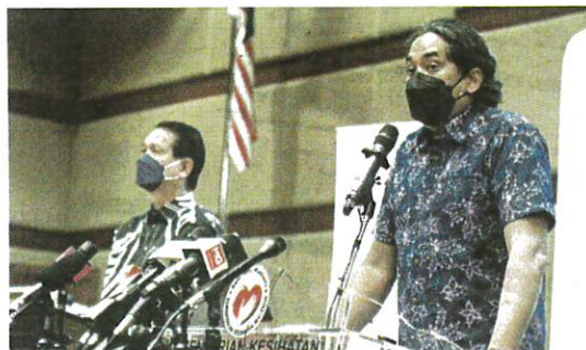
Health Minister Khairy Jamaluddin and Health director-general Tan Sri Dr Noor Hisham Abdullah at a press conference in Putrajaya yesterday.

Khairy said people aged 18 and above who received the Sinovac vaccine for their primary vaccination and senior citizens aged