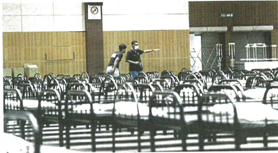
Preparatory work being carried out for the reopening of the Malaysia Agro Exposition Park Serdang Covid-19 Quarantine and Low-Risk Treatment Centre in Serdang yesterday.

"The PKRC is technically still within MAEPS. But its size, building, function and team will be different. With about 800 pa-