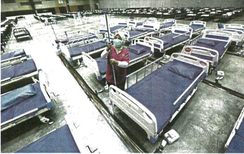
Pekerja membuat persiapan untuk membuka semula Pusat Kuarantin dan Rawatan COVID-19 Bersepadu di MAEPS, Serdang.