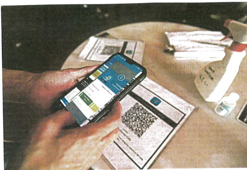
Some MySejahtera users are happy with the app.

She decided to come home to Seremban for her booster shot to avoid the long queue there. I registered her at the same private medical centre I