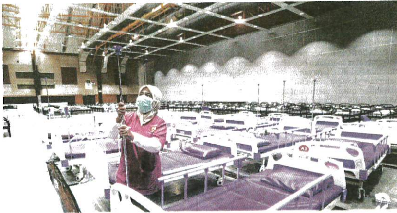
PETUGAS Pusat Rawatan dan Rawatan Covid-19 (PKRC) di Taman Ekspo Pertanian Malaysia Serdang (MAEPS) membuat persiapan bagi pembukaan semula pusat berkenaan ekoran peningkatan kes Covid-19.

"Selain itu, 108 kes telah menerima dua dos vaksin Covid-19 tetapi belum menerima dos penggalak; 41 kes sudah menerima dos penggalak," katanya dalam satu kenyataan semalam.