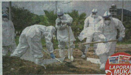
Kes kematian akibat Covid-19 mencatatkan peningkatan apabila KKM melaporkan sebanyak 55 kes pada Rabu.

MENDEPANI KRISIS COVID-19: APA TINDAKAN KITA?