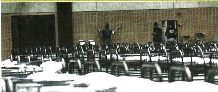
PETUGAS membuat persiapan untuk membuka semula Pusat Kuarantin dan Rawatan Covid-19 Bersepadu (PKRC) di Taman Ekspo Pertanian Malaysia (Maeps), Serdang, semalam.

Oleh Noor Atiqah Sulaiman am@hmetro.com.my