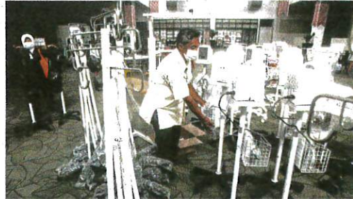
PETUGAS kesihatan bersiap sedia menerima pesakit di PKRC MAEPS, Serdang semalam.

AKHBAR : KOSMO MUKA SURAT : 4 RUANGAN : NEGARA